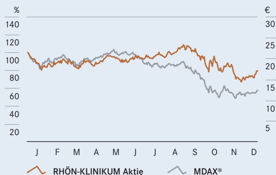
RHÖN-KLINIKUM Aktie im kurzfristigen Vergleich ...